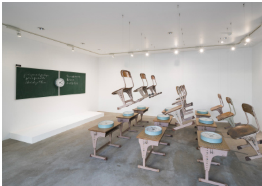
2016-2017, blackboard, chairs, desks, clocks and map. Exhibition view from Peripheral Vision, Art Front Gallery, 2017, Tokyo. Courtesy of the artist and Art Front Gallery, Tokyo. Ed. of 5 + 1 A.P.

This work was part of 3rd Setouchi Triennale, Awashima, 2016.