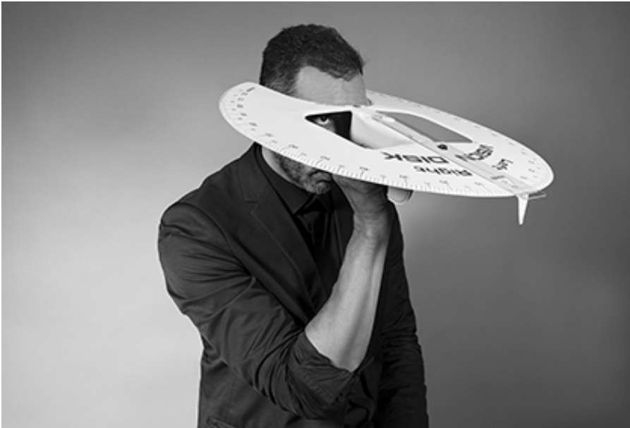
2017, Pigment print on fine art in 27 x 40cm, 35 x 52 cm and 70 x 105 cm each. Exhibition view from Peripheral Vision, Art Front Gallery, 2017, Tokyo. Ed. of 5 + 2 A.P.

« Vision périphérique » est une série de quatre portraits photographiques en noir et blanc représentant l'artiste de face, de dos et de profil, droit et gauche. Son visage disparaît en partie derrière un grand rapporteur d'angle circulaire blanc qu'il tient dans la main, à hauteur des yeux - yeux qui demeurent visibles grâce à deux ouvertures pratiquées au centre de l'instrument de géométrie. L'esthétique futuriste de ce dispositif renvoie à une approche artistique avant-gardiste, conçue comme un renouvellement du regard porté sur ce qui nous entoure, une prise de conscience de ce qui nous relie au monde et l'appréhension des limites de ce dernier. Dans son ouvrage, Tractacus logico-philosophicus , le philosophe autrichien Wittgenstein aborde la question des limites d'un point de vue essentiellement linguistique : « Les limites de mon langage signifient les limites de mon univers » La série proposée par « Vision périphérique » met en scène les carences du langage esthétique et son inaptitude à traduire la pensée de celui qui le met en œuvre. Elle élabore ainsi un projet artistique voué à l'échec avant même d'avoir pu être formulé.