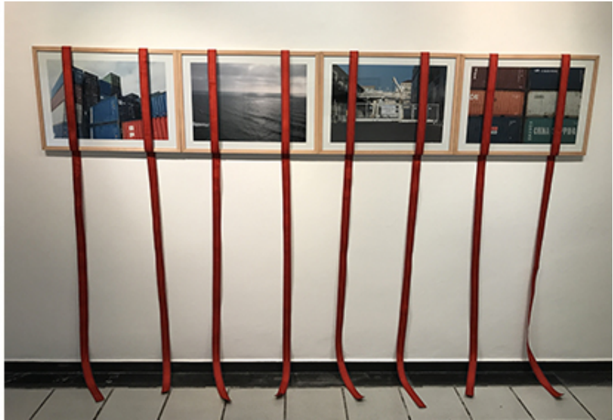
Series des photos commencée en 2013, rubans de transport orange. Exhibition view from Le Pavillon de l'Exile, Galerie Delacroix, 2017, Tanger. Ed. of 5 + 2 A.P.

This work was part of 57th Venice Biennale - Tunisian Pavilion, The Absence of Paths, Venice, 2017.