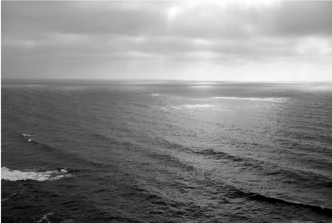
The Exile Pavilion

The photographic series « The Exile Pavilion » addresses the question of human displacement and migrations, a phenomenon that dates back to the origins of humanity but sharply increased in the early 2000s, with a dramatic turn, for economic, political and climatic reasons. These themes, along with those of separation, travel and encounters, are often addressed by mounir fatmi, who has always considered himself an immigrant worker in permanent exile.