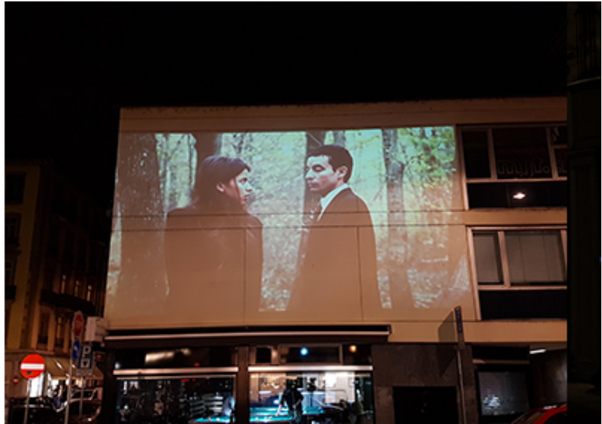
2017, France, 10'21" min, HD, Color, stereo. Size may vary, video projection. Exhibition view from (IM)possible Union, Analix Forever Gallery, 2017, Geneva.

« Le désir de l'homme trouve son sens dans le désir de l'autre » Lacan