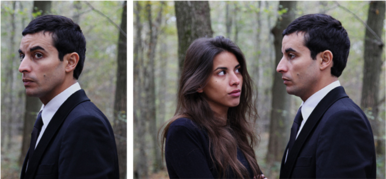
2017, France, 10 min 21, HD, color, stereo. Courtesy of the artist and Analix Forever, Genova. Ed. of 5 + 2 A.P.

« Le désir de l'homme trouve son sens dans le désir de l'autre » Lacan