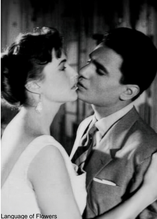
Language of Flowers

Language and metaphor: fatmi's flowers, woman and man, communicate as orchids might do. Black orchids: the clothes worn by the two actors – suit and dress – are black and seem almost interchangeable, even if they are defined and constrained by their gender.