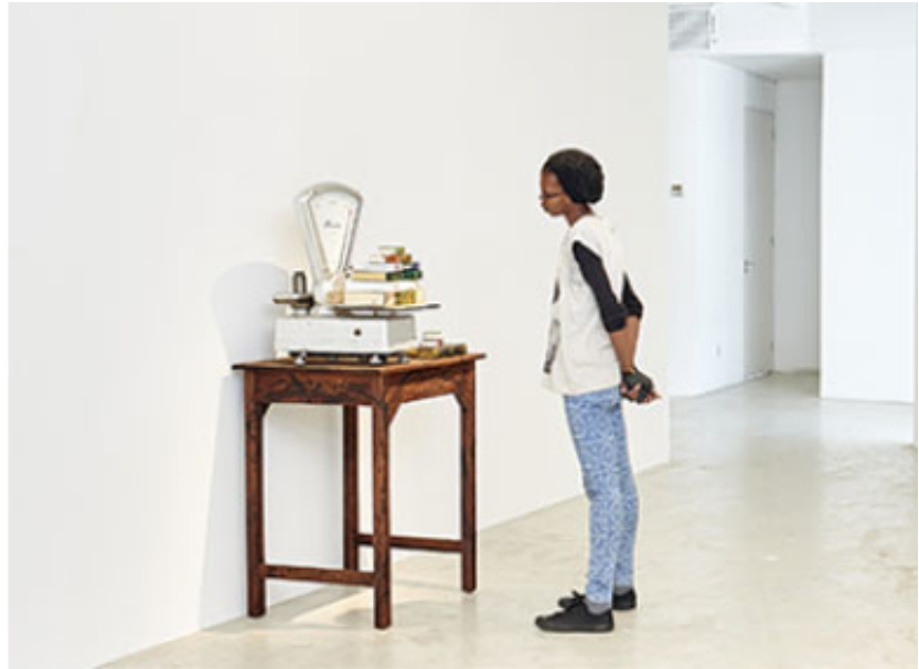
2017, Found objects, Variable. Exhibition view from Fragmented Memory , Goodman Gallery, 2017, Johannesburg. Ed. of 5 + 1 A.P.

Le Poids est une œuvre sculpturale composée d'une table en bois sur laquelle repose une ancienne balance commerciale, dont le plateau supporte une pile de livres constituée de plusieurs exemplaires du Coran, aux formats variés et rédigés dans différentes langues. Le livre est un matériau récurrent des œuvres de mounir fatmi où ses pouvoirs ambivalents de diffusion et de contrôle des idées sont étudiés. L'association du livre (ou d'un langage) et de la machine est observable dans d'autres réalisations telles que « Le paradoxe », « Technologia », ou encore « La Machine et l'Index » qui traite de la naissance de l'imprimerie et décrit la manière dont cette invention a révolutionné l'écriture, la culture et l'histoire des idées en permettant leur diffusion, mais également entraîné des phénomènes de censure massifs et sans précédent, avec des modèles de publication imposés à grande échelle.