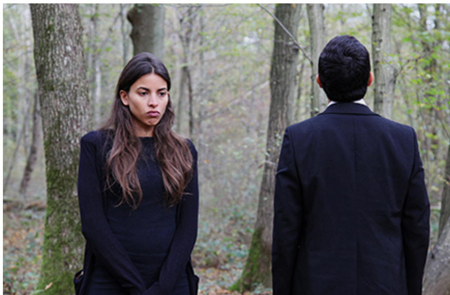
2013-2014, Series of 6 pigmented inks on fine art paper, 40 x 26 cm each one. Exhibition view from (IM)possible Union, Analix Forever, 2017, Geneva. Courtesy of the artist and Analix Forever, Geneva. Ed. of 5 + 2 A.P.

« Le désir de l'homme trouve son sens dans le désir de l'autre » Lacan