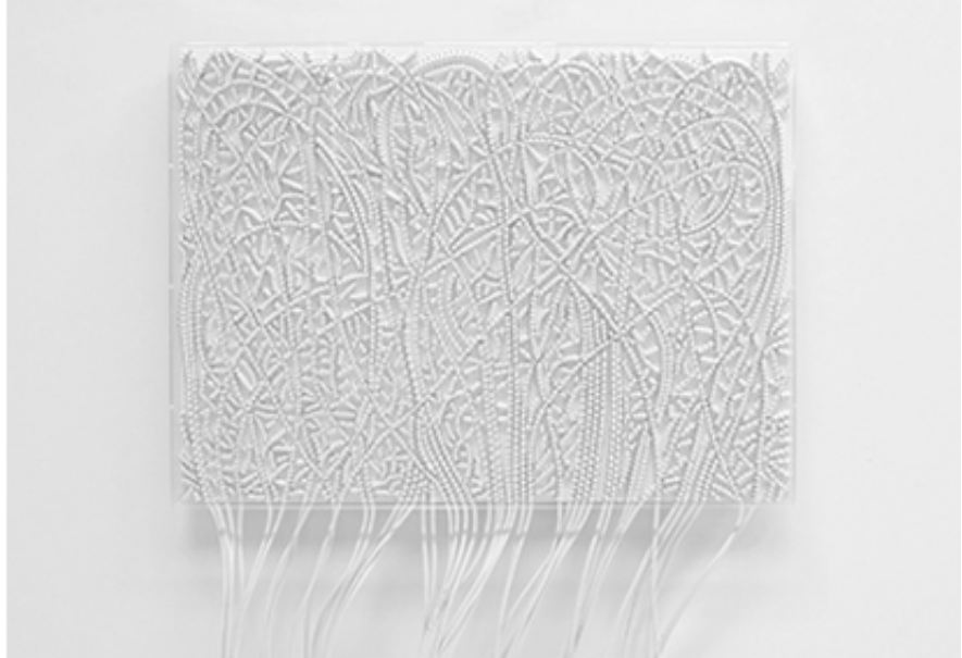
2016, coaxial antenna cable and staples, 111cm x 80,5cm. Extension cable 112cm