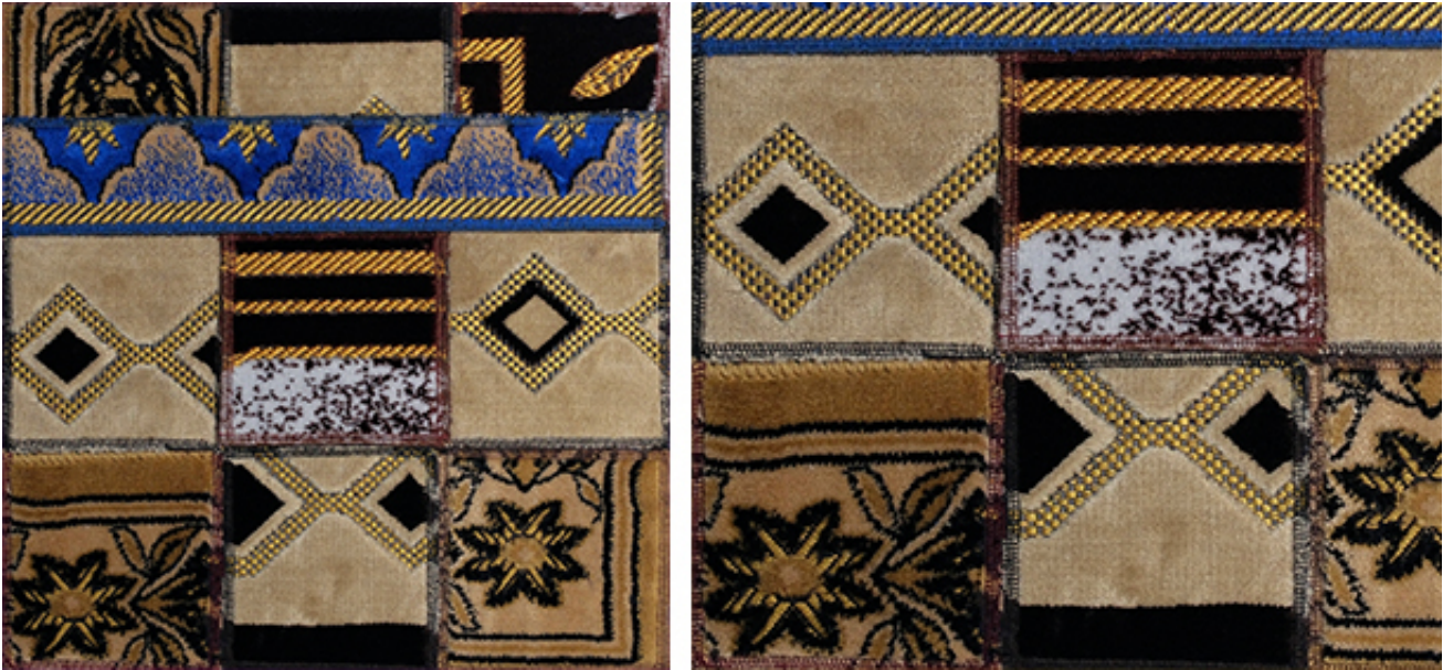
2023-2024, collages of prayer rugs on canvas, 30 x 30 cm. Courtesy of the artist.