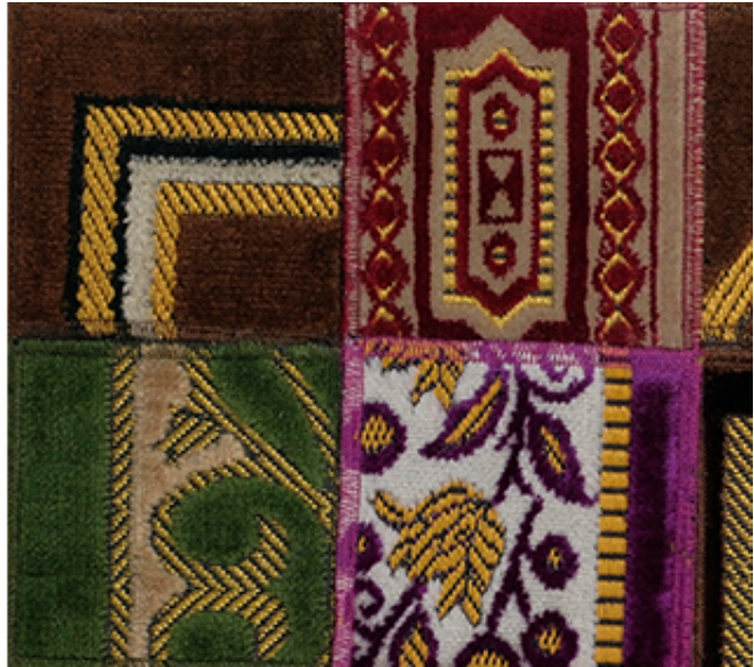
2023-2024, collages of prayer rugs on canvas, 30 x 30 cm. Courtesy of the artist.