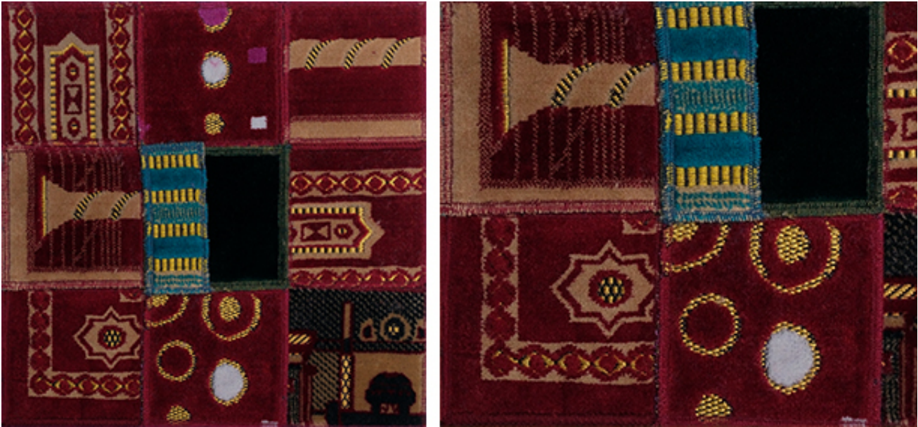
2023-2024, collages of prayer rugs on canvas, 30 x 30 cm.