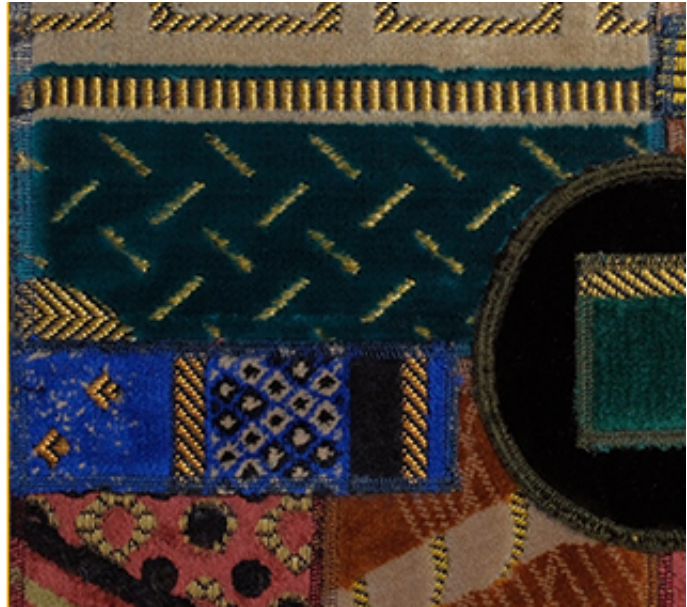
2023-2024, collages of prayer rugs on canvas, 30 x 30 cm.