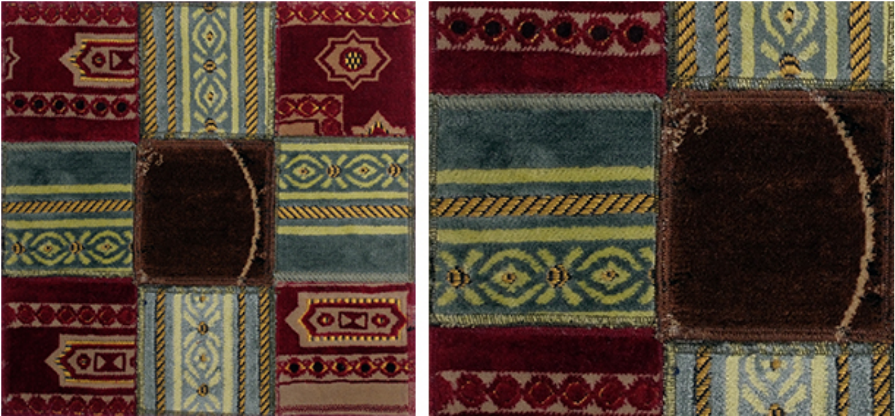
2023-2024, collages of prayer rugs on canvas, 30 x 30 cm.