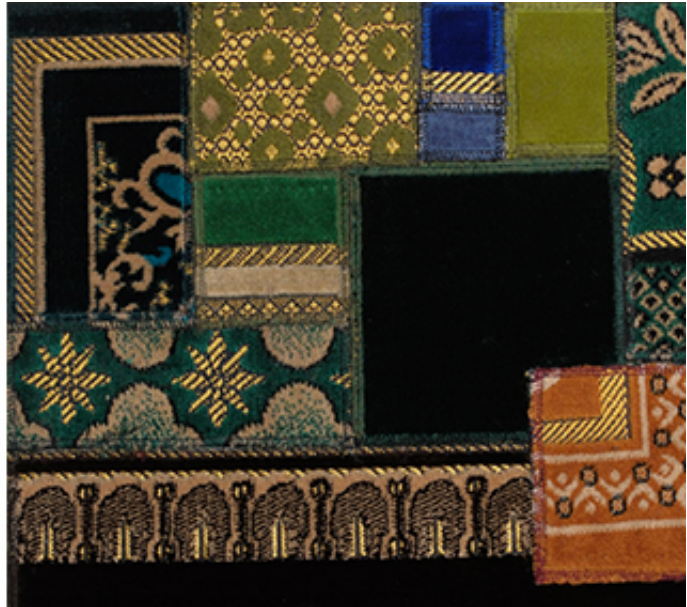
2023-2024, collages of prayer rugs on canvas, 40 x 40 cm.