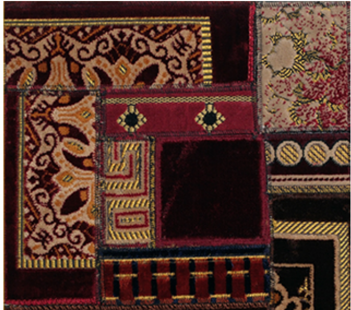
2023-2024, collages of prayer rugs on canvas, 40 x 40 cm. Courtesy of the artist.