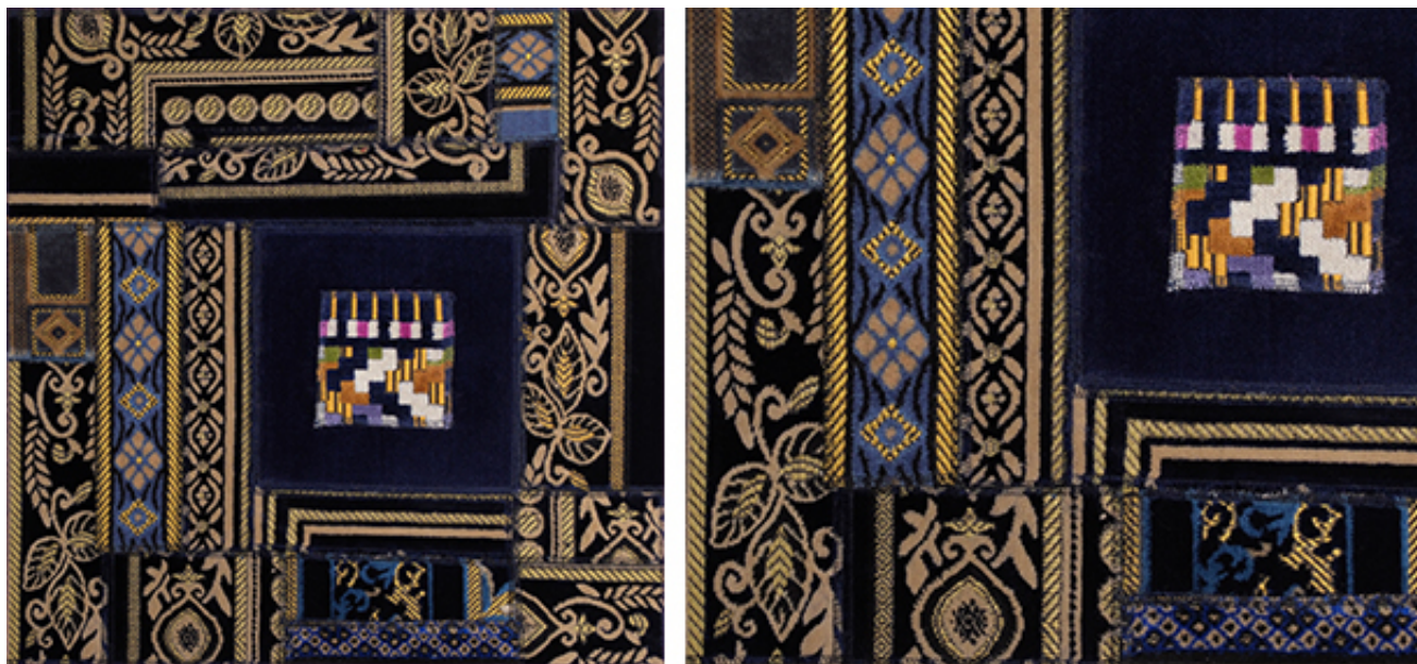
2023-2024, collages of prayer rugs on canvas, 50 x 50 cm. Courtesy of the artist.