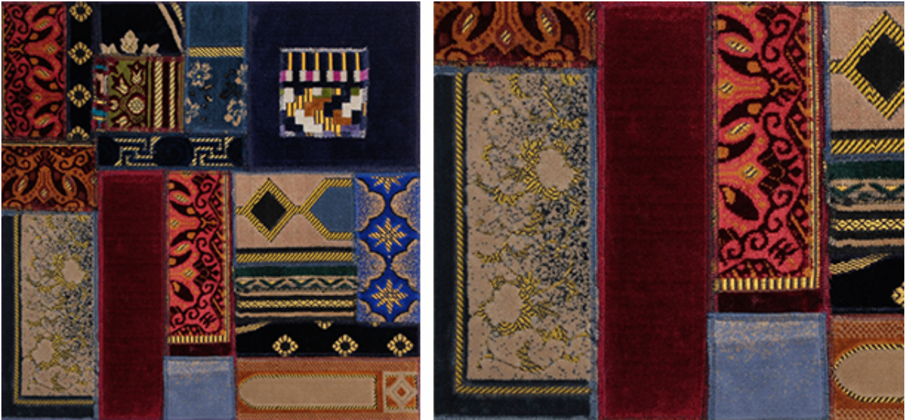
2023-2024, collages of prayer rugs on canvas, 50 x 50 cm. Courtesy of the artist.