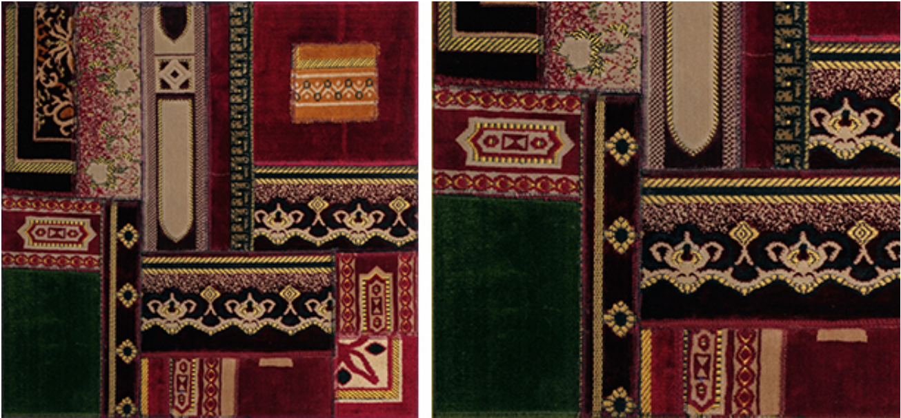
2023-2024, collages of prayer rugs on canvas, 50 x 50 cm. Courtesy of the artist.