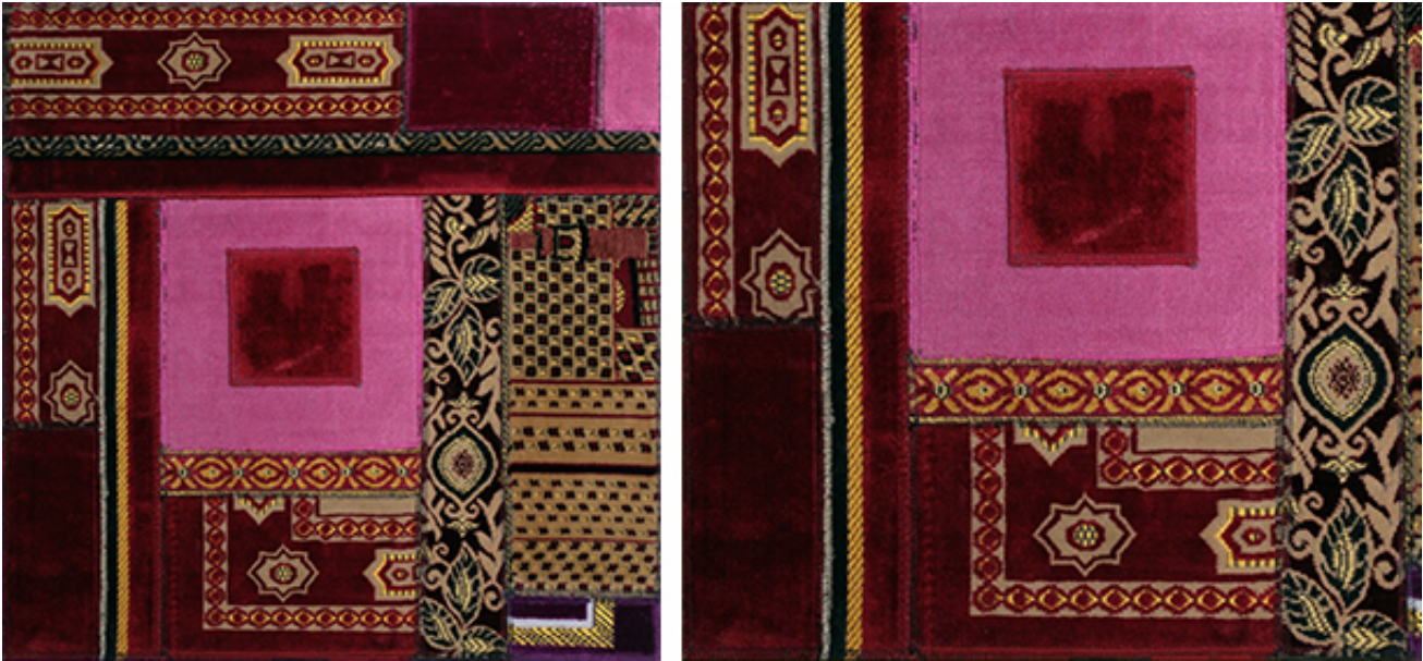
2023-2024, collages of prayer rugs on canvas, 50 x 50 cm.