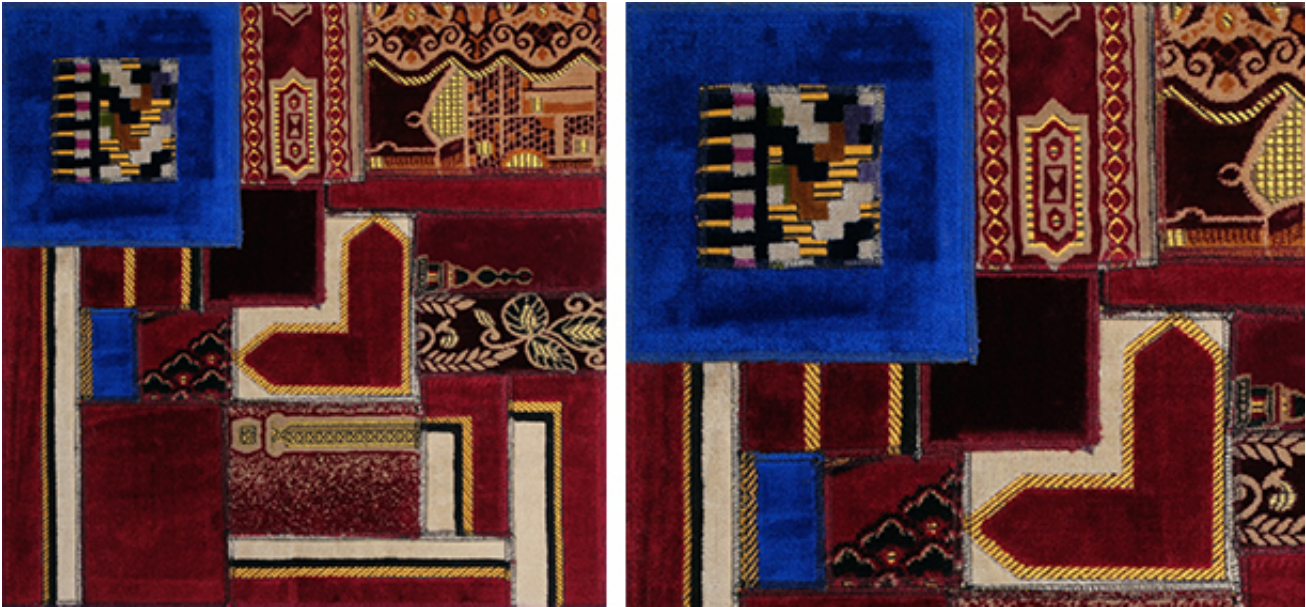
2023-2024, collages of prayer rugs on canvas, 50 x 50 cm.