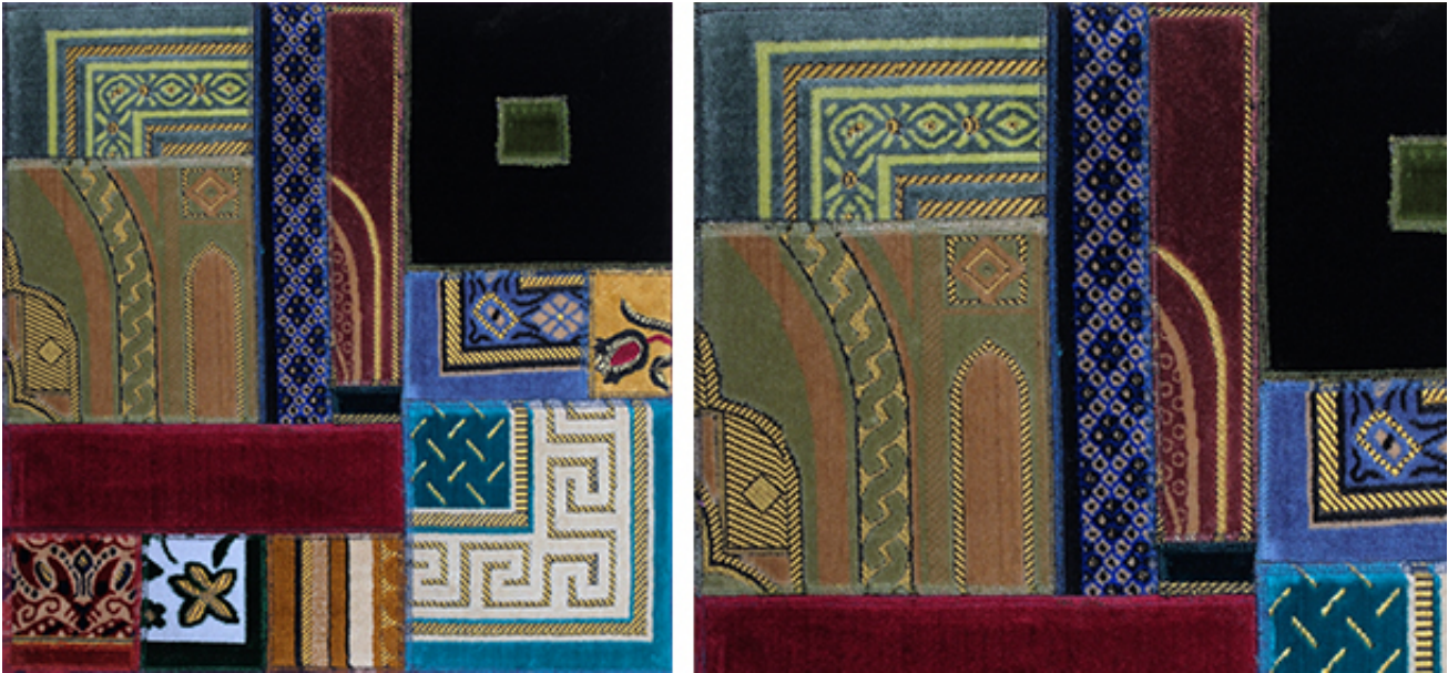
2023-2024, collages of prayer rugs on canvas, 50 x 50 cm. Courtesy of the artist.