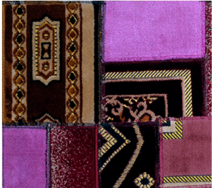
2023-2024, collages of prayer rugs on canvas, 50 x 50 cm. Courtesy of the artist.