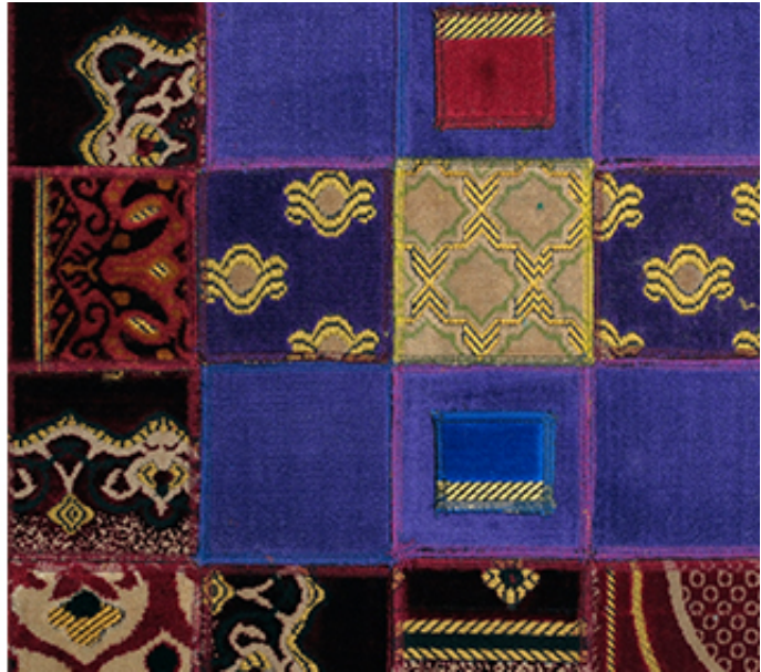
2023-2024, collages of prayer rugs on canvas, 50 x 50 cm.