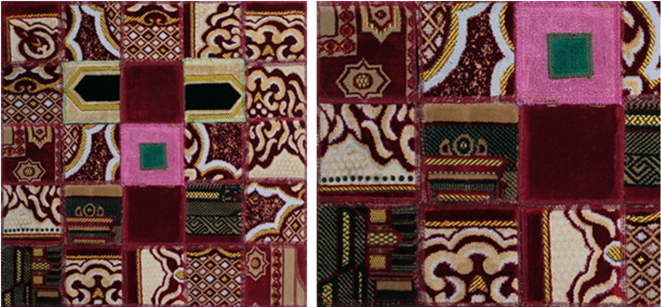
2023-2024, collages of prayer rugs on canvas, 50 x 50 cm.