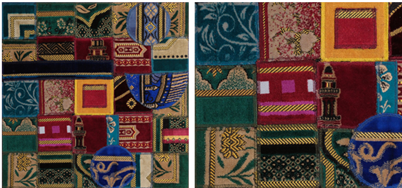
2023-2024, collages of prayer rugs on canvas, 50 x 50 cm. Courtesy of the artist.