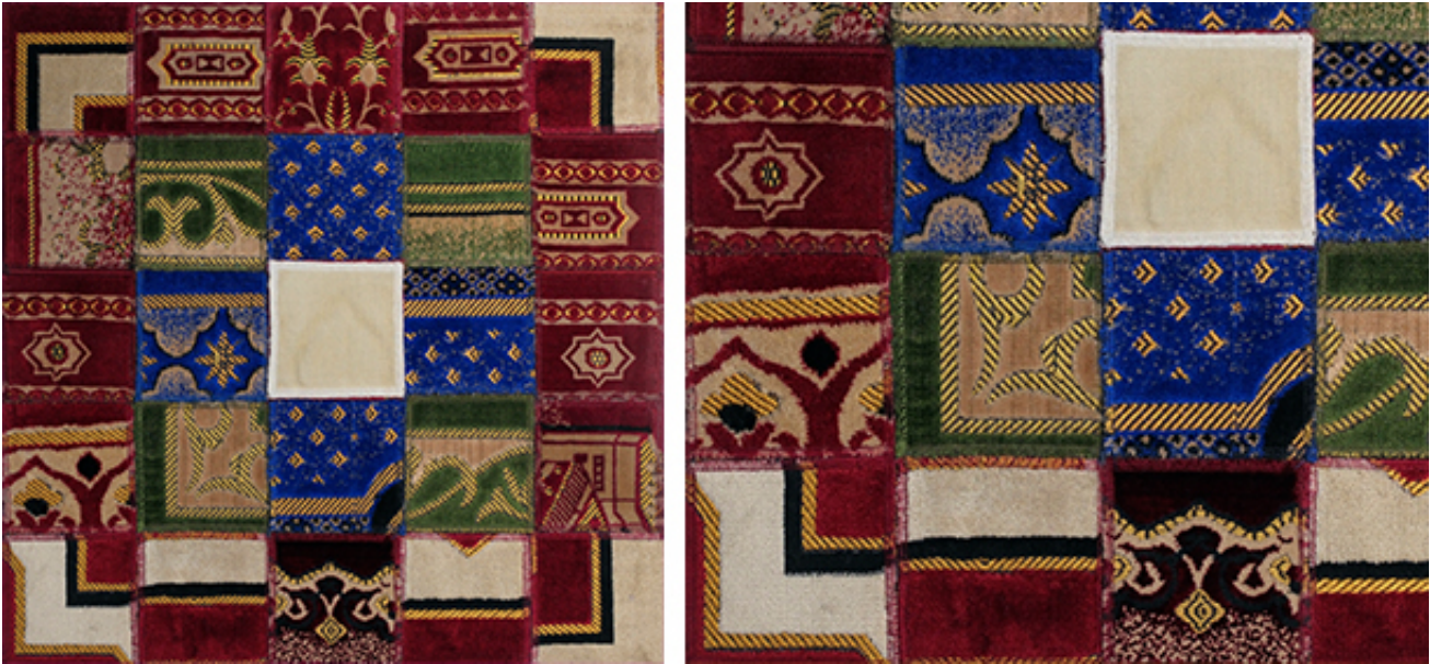
2023-2024, collages of prayer rugs on canvas, 50 x 50 cm. Courtesy of the artist.