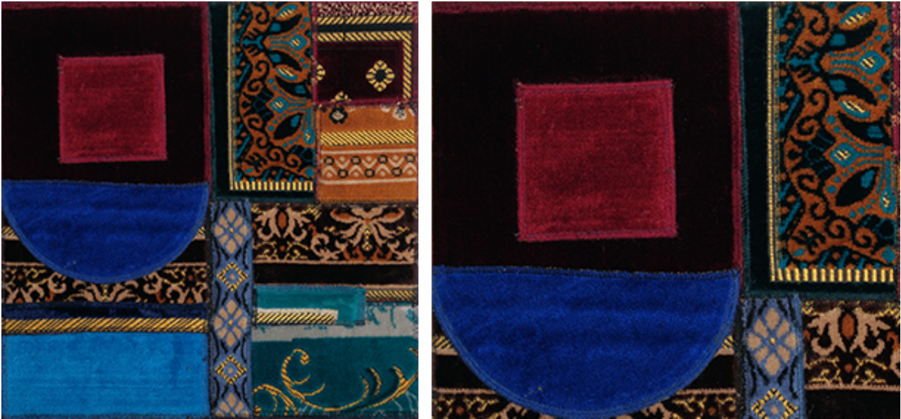
2023-2024, collages of prayer rugs on canvas, 40 x 40 cm.