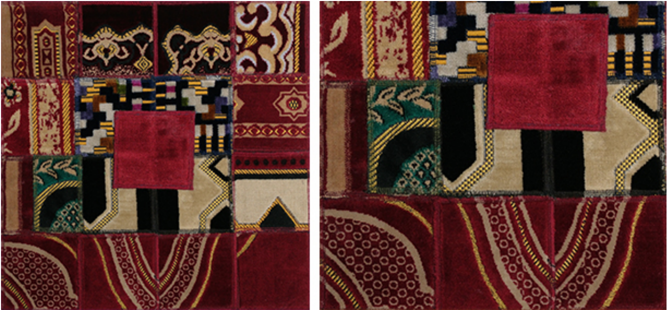
2023-2024, collages of prayer rugs on canvas, 40 x 40 cm. Courtesy of the artist.