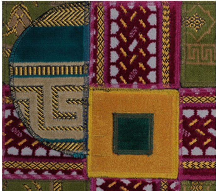
2023-2024, collages of prayer rugs on canvas, 30 x 30 cm.