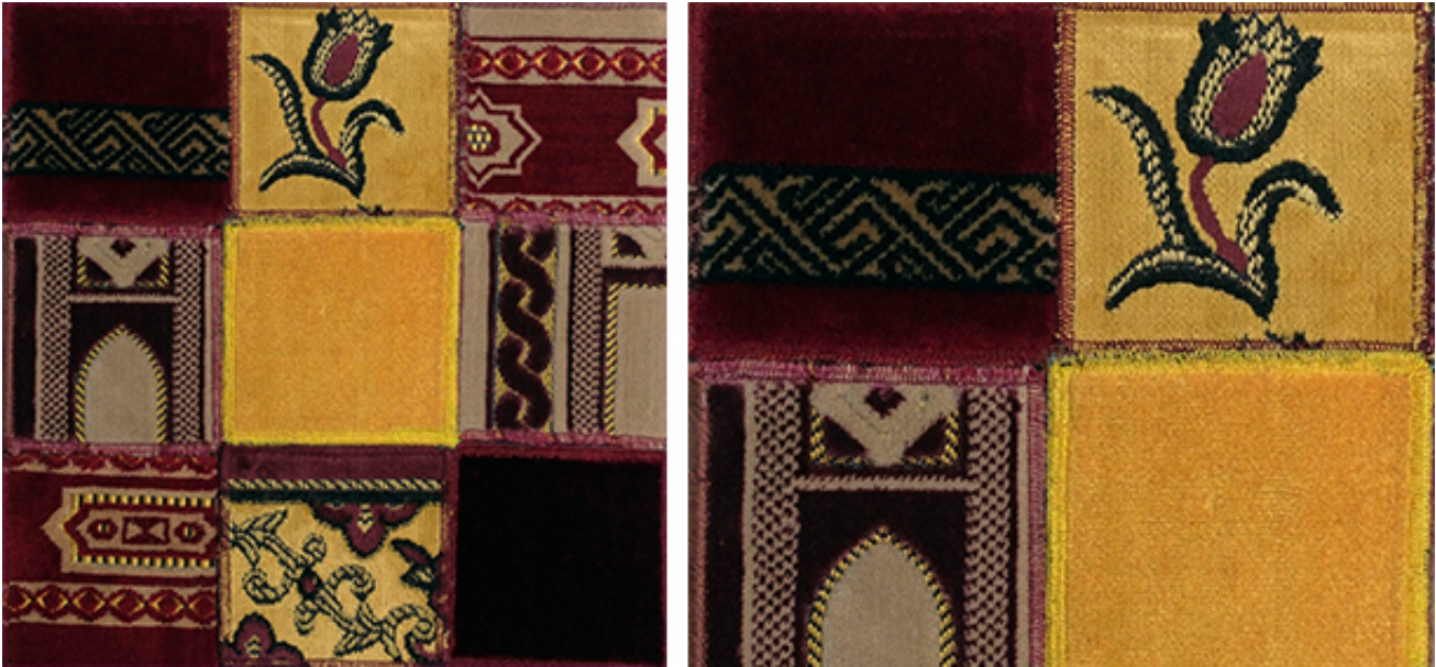
2023-2024, collages of prayer rugs on canvas, 30 x 30 cm. Courtesy of the artist.