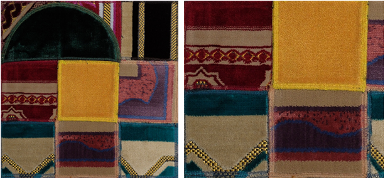
2023-2024, collages of prayer rugs on canvas, 30 x 30 cm. Courtesy of the artist.