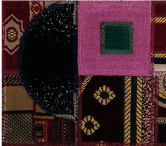
2023-2024, collages of prayer rugs on canvas, 30 x 30 cm.