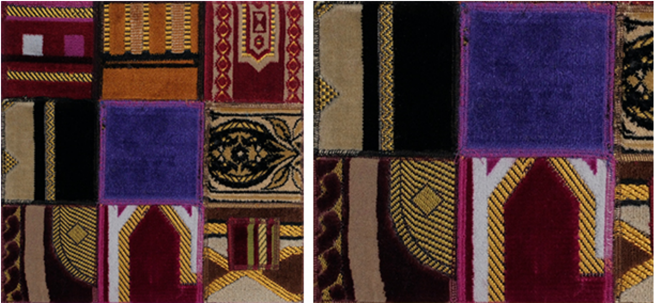
2023-2024, collages of prayer rugs on canvas, 30 x 30 cm.