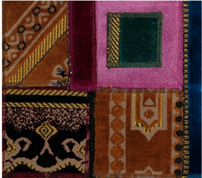
2023-2024, collages of prayer rugs on canvas, 30 x 30 cm.