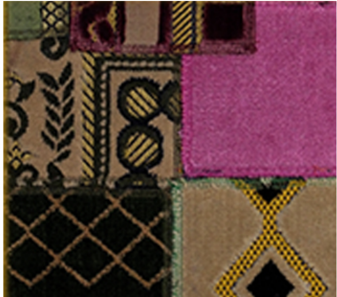
2023-2024, collages of prayer rugs on canvas, 30 x 30 cm.