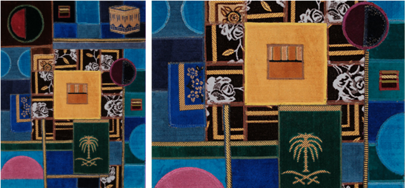
2023-2024, collages of prayer rugs on canvas, 65 x 81 cm. Courtesy of the artist.