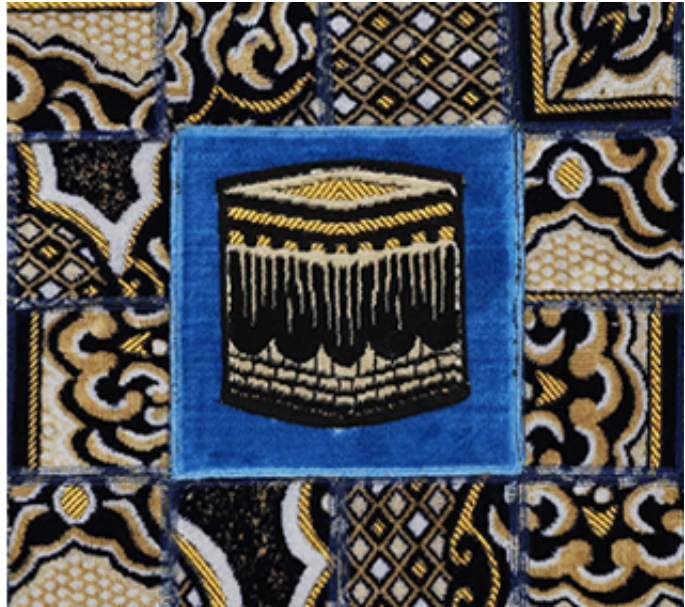
2018, collages of prayer rugs on canvas, 200 x 200 cm.