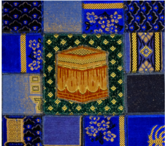
2016, collages of prayer rugs on canvas, 80 x 80 cm.