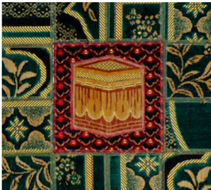
2016, collages of prayer rugs on canvas, 80 x 80 cm.