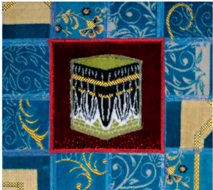
2016, collages of prayer rugs on canvas, 80 x 80 cm.