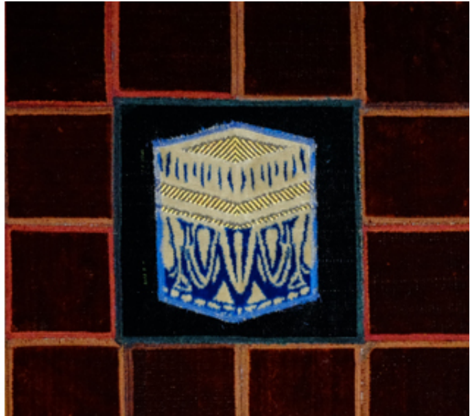
2016, collages of prayer rugs on canvas, 80 x 80 cm.