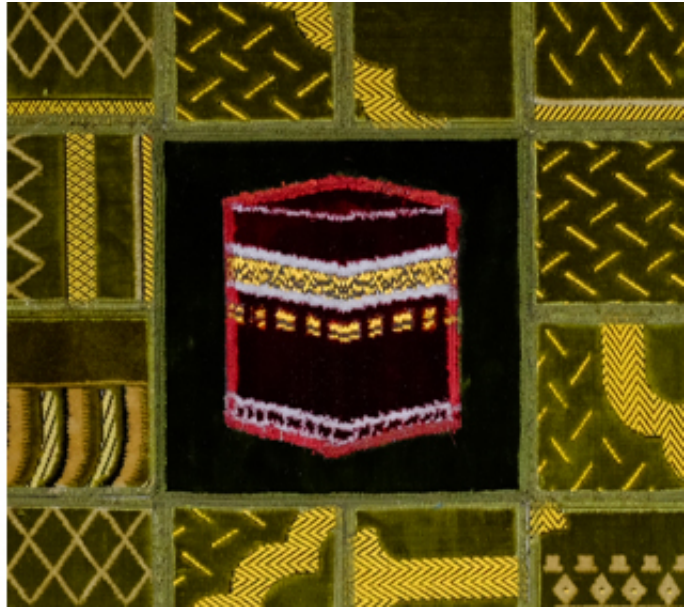
2016, collages of prayer rugs on canvas, 80 x 80 cm.