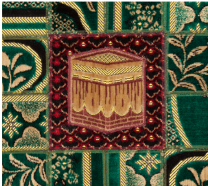
2014-2015, collages of prayer rugs on canvas, 80 x 80 cm.