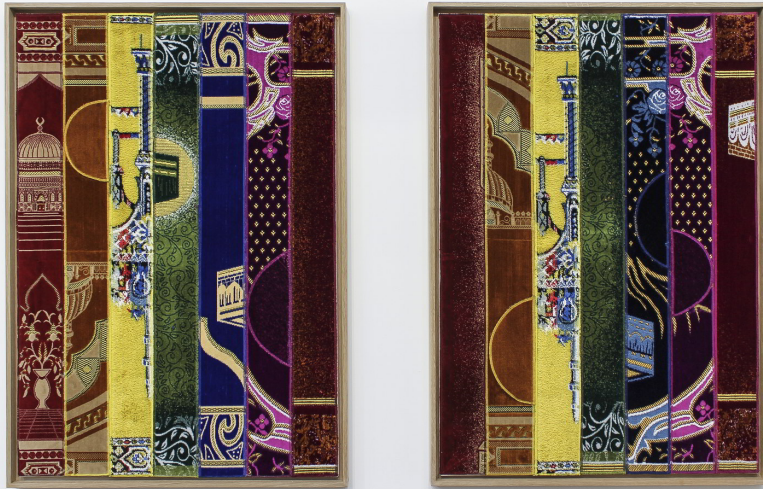
Behind the Rainbow

By combining fragments of prayer rugs from both, Fatmi constructed a series of five, rainbow hued collages titled, Behind the Rainbow (Derriere l'arc en ciel). Made between 2014-2015, the series shows the rainbow/ROYGBIV gradation now universally linked to the flag and symbol for LGBTQ rights, fused with a symbol of a religion that still refuses to accept homosexuality.