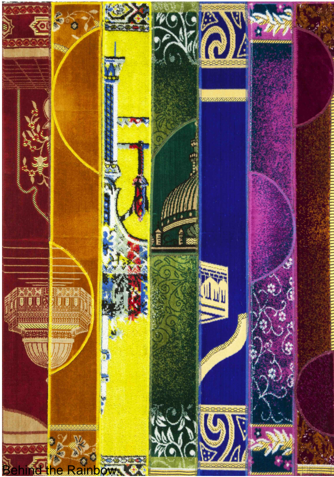
Behind the Rainbow

He is married himself and he recently married two Iranian women in Sweden, but he is also using the Koran itself to educate others about the real beliefs of the Prophet on this subject and the misinformation about homosexuality which has gone rampant in the religion. Small steps perhaps, but steps in a positive direction.