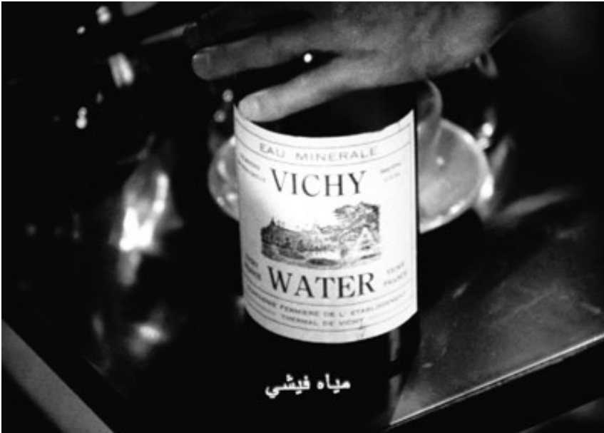
2014, pigment print on baryta, 37 x 50 cm. Exhibition view from Constructing Illusion, Analix Forever, 2015, Geneva. Ed. of 5 + 2 A.P.

Les photographies regroupées sous le titre « Vichy Water » participent à un work in progress initié en 2014, à partir du film « Casablanca » de Michael Curtiz, réalisé en 1942, qui a pour acteurs principaux Humphrey Bogart et Ingrid Bergman. Le film constitue une source d'inspiration importante pour mounir fatmi, à l'origine de plusieurs œuvres, telles que les séries de photomontages « Casablanca circles » ou « Les Affaires des sphères » (2012).