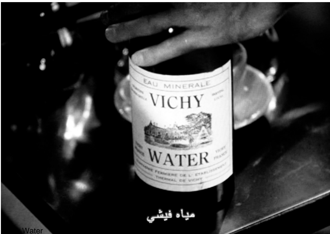
The movie Casablanca tells the story of an impossible love in the context of World War II, and narrates the adventures of a couple trying to leave Europe and flee Nazism, arriving in Morocco first in order to obtain the necessary papers to reach the United States.