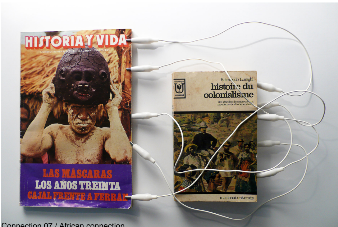
Connection 07 / African connection

Espace des arts de Colomiers, December 2004