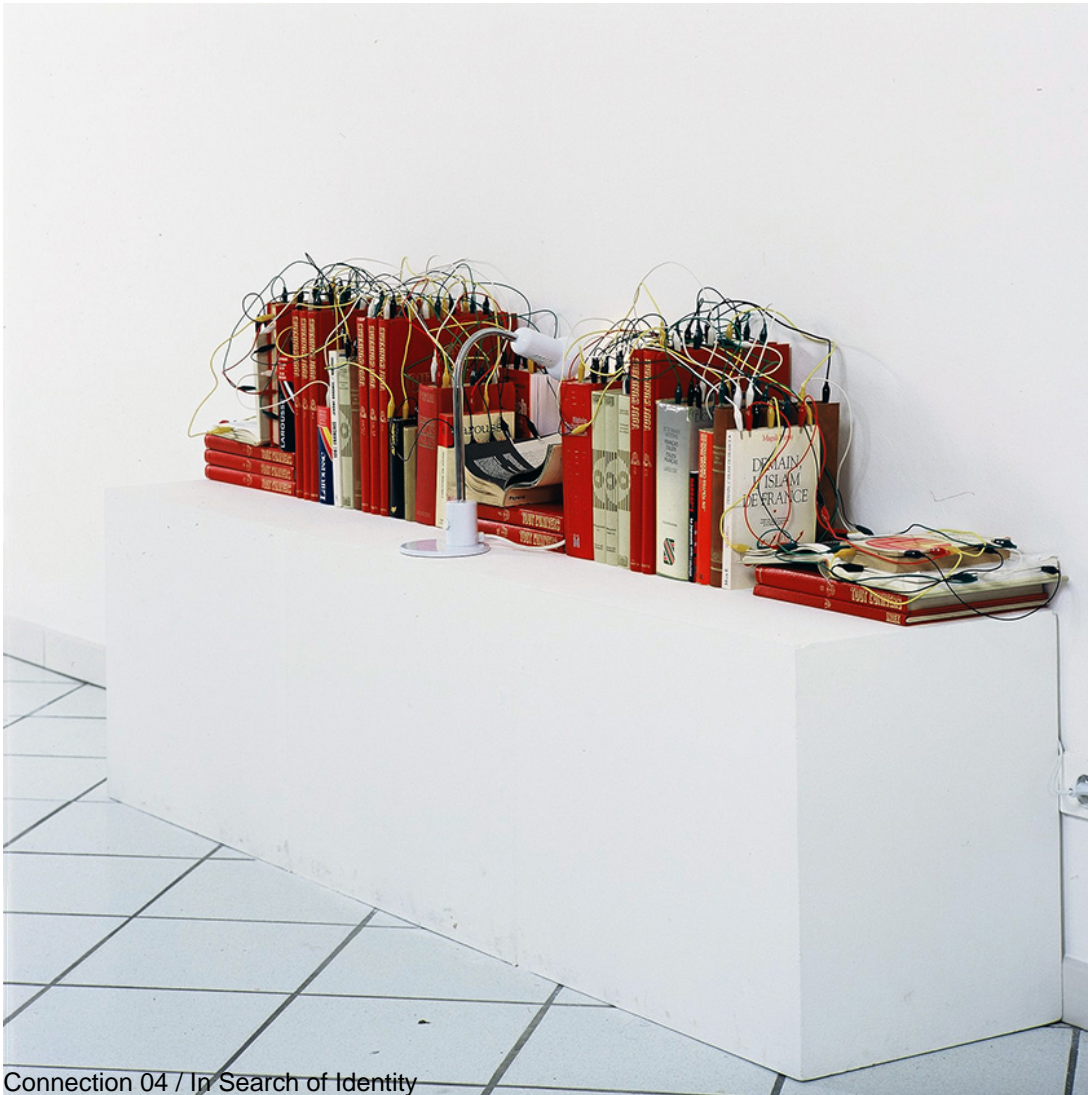
Connection 04 / In Search of Identity

Each connection between the books arouses curiosity: how and why are they connected? This is where the viewer is ensnared: taken in rather than moving away from this apparently heterogeneous object, which looks like a homemade bomb with all of the connecting wires. We are seduced despite – or maybe because of – a sense of danger.