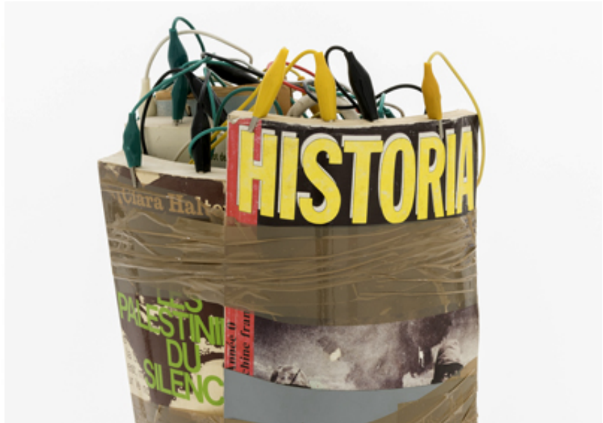
2004-2007, books, connection cables, pedestal, plexiglass. Ed. of 1 + 1 A.P.

Le souci du lien, de la mise en relation, du réseau est au cœur du travail de mounir fatmi depuis sa genèse, dans des approches plastiques et conceptuelles variables. A partir de 2004, il entreprend une nouvelle configuration de cette réflexion, en relation intime avec celle qu'il mène sur la valeur du savoir, dans cette invention poétique que sont Les connexions . Comme la plupart des propositions de l'artiste, celle-ci se constitue dans une stratification de sens se déployant autour d'axes majeurs : esthétique, éthique, culturel, politique, existentiel.