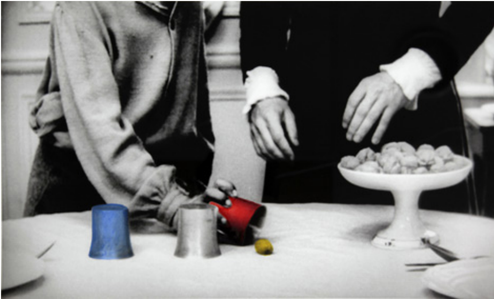
The Game, 2012, Series of 9 prints on baryta, hand-painted intervention, 40 x 50 cm View from Suspect Language, Goodman Gallery, 2012, Cape Town. Ed. of 5 + 2 A.P.

L'œuvre photographique The Beautiful language présente six séries de photographies en noir et blanc portant chacune un titre : "Le Jeu", "Le Bandeau", "La Crise", "La Punition", "Le Piège" et enfin "La Naissance". Les images en noir et blanc sont extraites du film L'Enfant sauvage de Truffaut (1970) qui s'inspire de l'histoire vraie d'un enfant non civilisé et ne possédant pas le langage qui se voit un jour capturé par des paysans au 18e siècle, puis recueilli par un médecin qui l'étudie et fait son éducation. Les images comportent des éléments colorisés et donnent également à voir des motifs calligraphiques en surimpression, occultant partiellement la scène et les personnages présents.