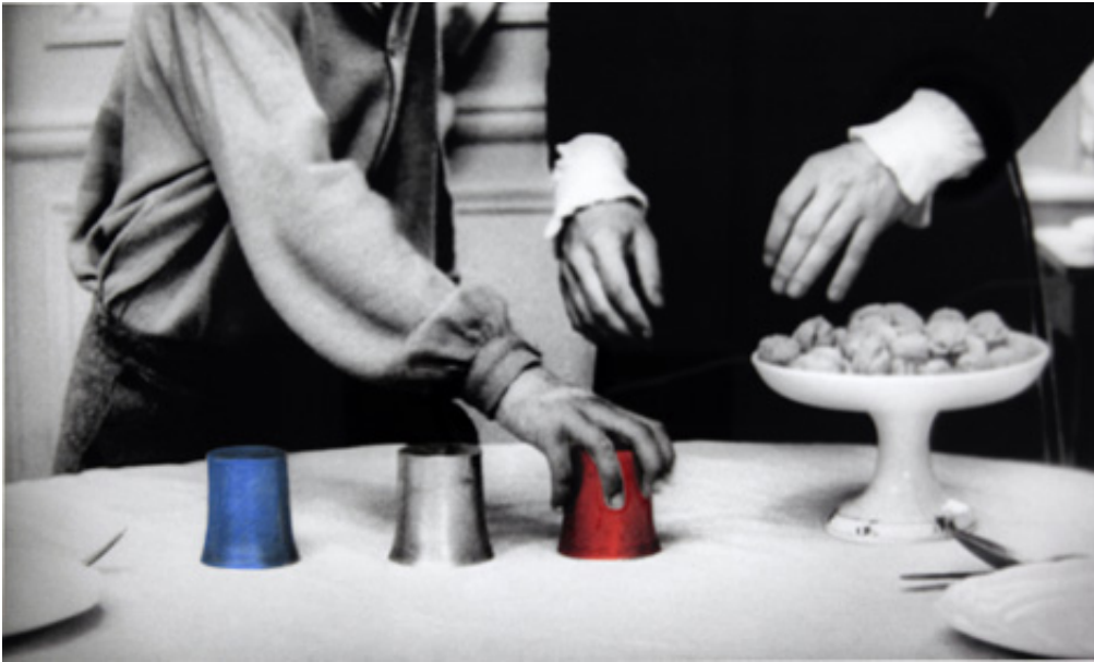
The Game, 2012, Series of 9 prints on baryta, hand-painted intervention, 40 x 50 cm View from Suspect Language, Goodman Gallery, 2012, Cape Town. Ed. of 5 + 2 A.P.

L'œuvre photographique The Beautiful language présente six séries de photographies en noir et blanc portant chacune un titre : "Le Jeu", "Le Bandeau", "La Crise", "La Punition", "Le Piège" et enfin "La Naissance". Les images en noir et blanc sont extraites du film L'Enfant sauvage de Truffaut (1970) qui s'inspire de l'histoire vraie d'un enfant non civilisé et ne possédant pas le langage qui se voit un jour capturé par des paysans au 18e siècle, puis recueilli par un médecin qui l'étudie et fait son éducation. Les images comportent des éléments colorisés et donnent également à voir des motifs calligraphiques en surimpression, occultant partiellement la scène et les personnages présents.